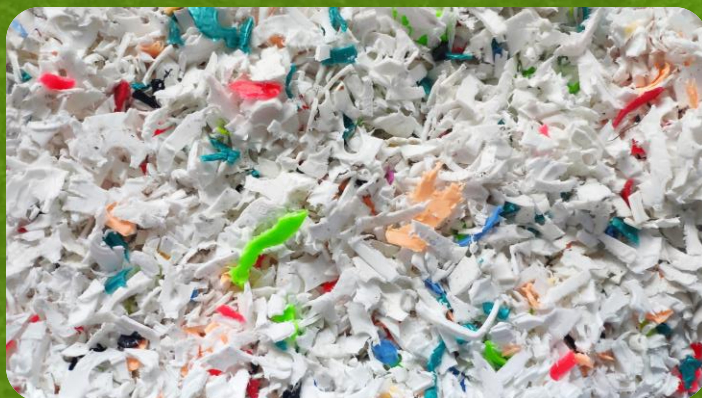
Sesbíraný materiál rozřežeme