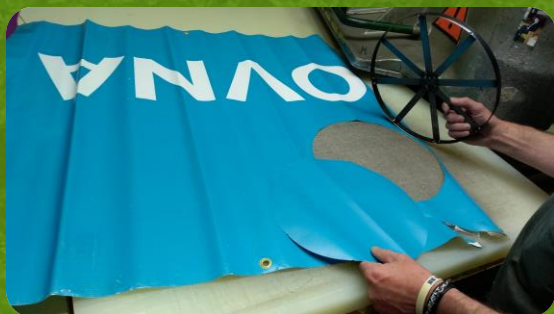
Převzmemme použité reklamní bannery