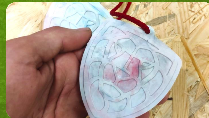
Po vychladnutí a začištění je na světě medaile