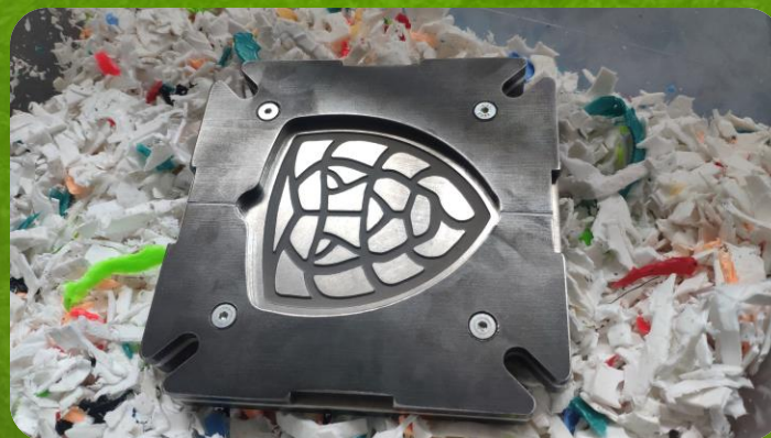
Roztavený materiál putuje do vstřikovací formy