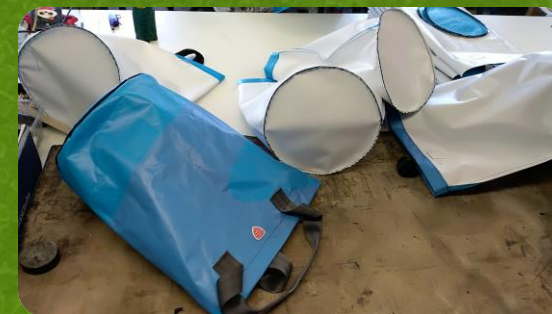
Z bannerů jsou Rekoše pro sběr míčků