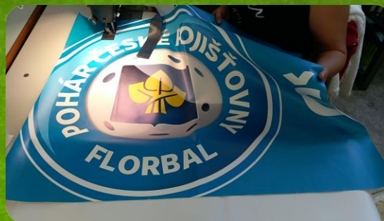
Komponenty sešijeme dohromady