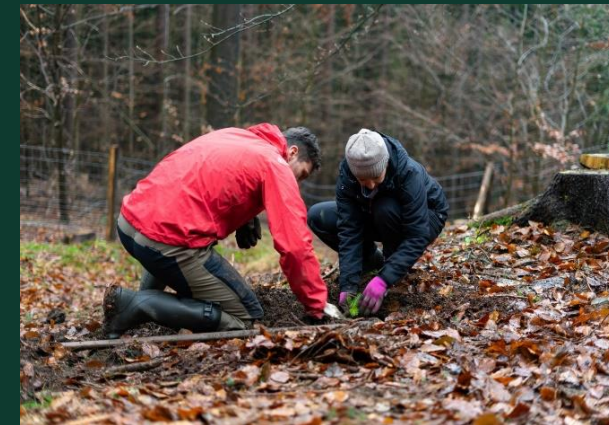
Grantový program ŠKODA Stromky - vývoj